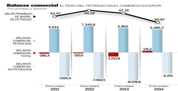
Figura 2. Balanza comercial: El precio del petróleo en el comercio exterior Fuente: (El Universo, 2015)

Nuestro emisor, el Banco Central del Ecuador de acuerdo a sus datos que son fidedignos y evidentes, las exportaciones petroleras generaron aproximadamente $12,100 millones de dólares con un saldo para el país de casi $ 6,400 millones frente a las importaciones, que permitió marcar una diferencia y equilibrar la balanza comercial total. Analizamos en la figura 2 las cifras que van relacionadas a la balanza comercial desde el 2011 hasta el 2014.