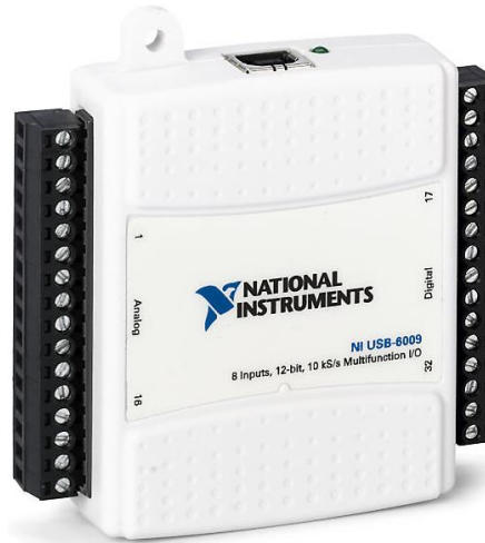
Figura 1. Tarjeta NI-USB 6009

Para la implementación del proyecto, se utilizó una tarjeta NI-USB 6009, de National Instruments, que se conecta al computador por medio del puerto serial (USB) y que tiene 12 entradas-salidas digitales, 4 entradas analógicas, 2 salidas analógicas. Y los valores de voltajes de las señales digitales son de 0 y 5 voltios. Y las señales analógicas pueden variar entre -10 y 10 Voltios.