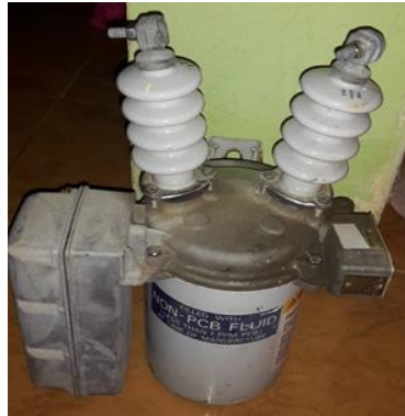
Figura 5. Interruptor Eléctrico 15KV.

líneas que está protegiendo. Si el valor del voltaje aplicado a las líneas que el interruptor está protegiendo disminuye en forma continua de un valor menor al prefijado, el interruptor se desconecta. Pero si el voltaje cae por debajo del voltaje prefijado por un periodo inferior a un determinado tiempo, el interruptor no se abre, es decir continúa cerrado (conectado), ya que lo interpreta como la entrada en funcionamiento de algún equipo eléctrico conectado en las líneas que está protegiendo.