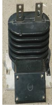
Figura 3. Transformador de Corriente.

Se utilizó un transformador de corriente, que sirve para disminuir la corriente, a valores que pueda manejar la tarjeta utilizada, es decir entre -10 y 10 amperios, del transformador de corriente con relación de 20 a 5 Amperios. Cabe indicar que los transformadores de corriente y potencial son aislados a 15 Kv y de uso a la intemperie.