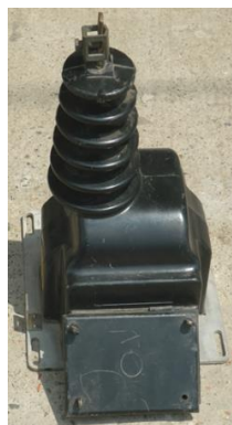
Figura 2. Transformador de Potencial.

Se utilizó un transformador de potencial, que servirá para disminuir el voltaje, a valores que pueda manejar la tarjeta utilizada, es decir entre -10 y 10 voltios, es decir un transformador de potencial con relación 8400 a 120 Voltios y otro transformador de 120 a 5 voltios.