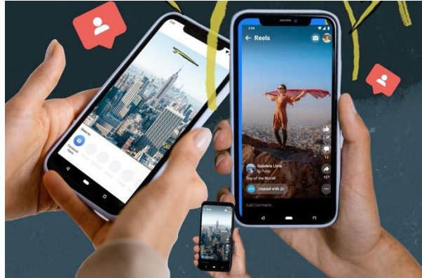
Figura 1. Instagram como una fuente de entretenimiento

Nota: Los participantes utilizaban Instagram principalmente como una fuente de entretenimiento