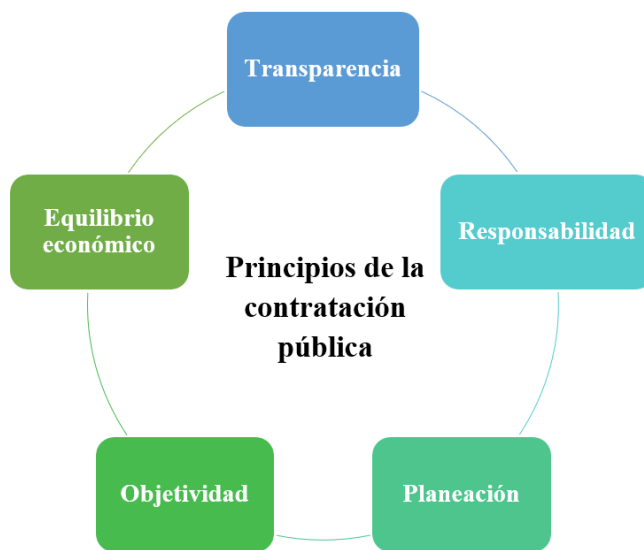
Figura 1. Principios de la contratación pública

Existen unos principios [ver figura 1] propuesto por Rozenwurcel y Drewes (2012), que resultan interesante desde el punto de vista axiológico, que permiten darle relevancia a la importancia que significa la contratación pública y que se detalla a continuación: