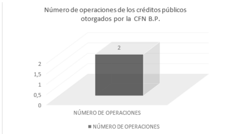
Diagrama de Barras para Indicar el Número de Operaciones Entregadas por la CFN en el Período 2017-2020.

Nota. Sistema de Información Pública Agropecuaria (SIPA) Fuente: Autoría propia