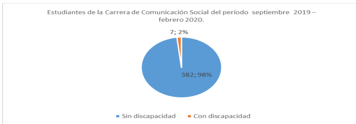
Figura 1. Estudiantes de la carrera de Comunicación Social cohorte Sep. 2019 – Feb 2020.

Como resultado de la revisión documental de la información proporcionada por la IES, con la utilización del método analítico se procedió al análisis de los datos, y a través del método estadístico se logró obtener los datos para la construcción de tablas y gráficos estadísticos.